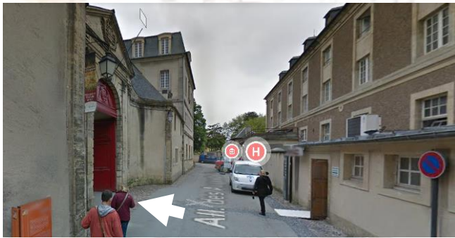
Allée des Augustines : entrée du musée

Durée de visite environ 1h30. (ATTENTION ! Tout commentaire ou guidage oral dans la galerie d'exposition de l'œuvre est interdit)